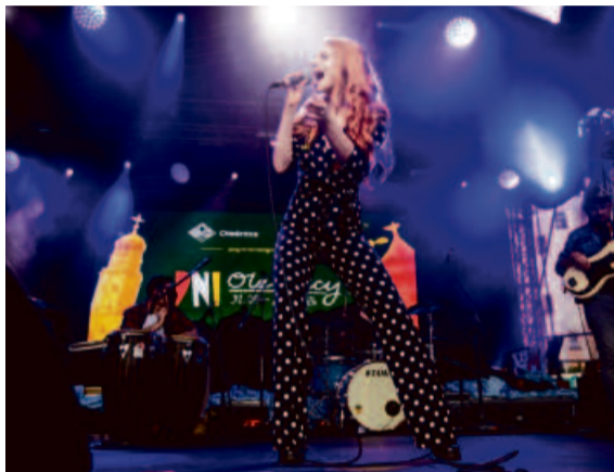
The Tricky Things zagrało bluesa, przełamując schematy