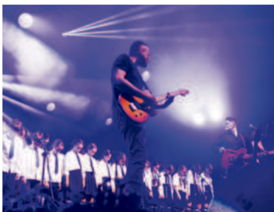
W hołdzie zespołowi Pink Floyd, z udziałem młodych chórzystów z Sycowa