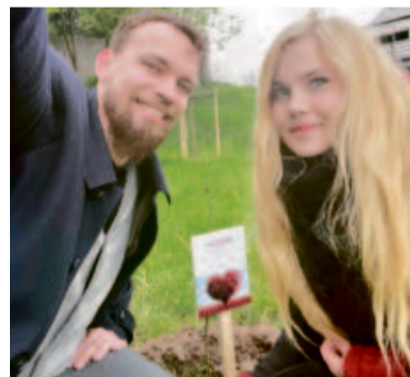
Zasadzili swoje „drzewo miłości”

Park został oficjalnie otwarty z okazji pierwszego dnia wiosny 2024 z udziałem uczniów naszych szkół podstawowych. Każdego dnia można zobaczyć spacerujących tu ludzi, bawiące się dzieci, młodzież trenującą na siłowni. Drzewa i rośliny zrobiły się zielone i cieszą oko. ●