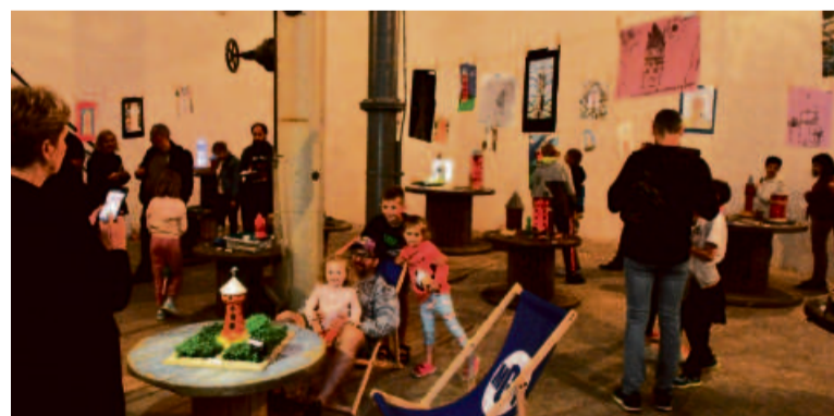
Raz w roku okazja, by wejść do wieży ciśnień