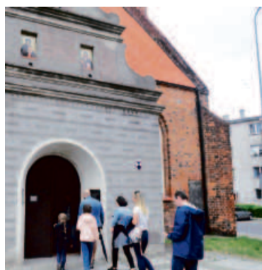
Co kryje się we wnętrzu oleśnickiej cerkwi?

Dorosłym trudno było ominąć w sobotnie popołudnie Lotny Festiwal Piwa, który kolejny raz - na dwa dni - zagościł w naszym mieście, ożywiając Rynek. ●