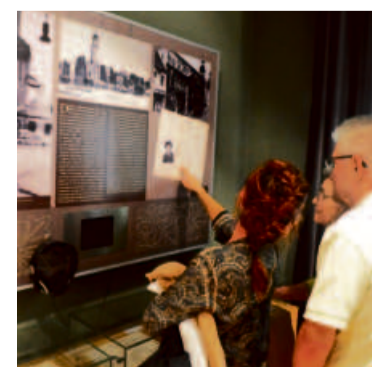
Kopalnia ciekawostek - Oleśnicki Dom Spotkań z Historią