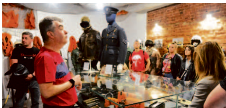
Muzeum Foteli Katapultowych oferuje więcej niż można się spodziewać