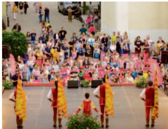
Gwardia Gryfa zaprezentowała efektowny spektakl „Na styku królestw”