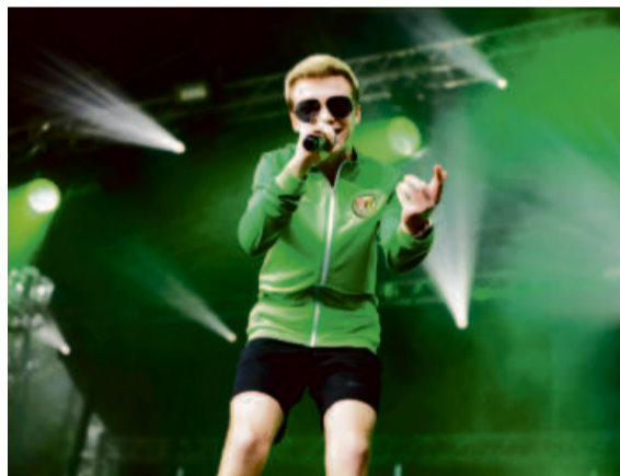
WonerS – najmłodszy piosenkarz disco polo