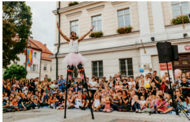
OFCA zawsze zaskakuje widzów i budzi ich gorące emocje.

Dodam, że Aurillac jest festiwalem, który odbywa się w miejscowości podobnej do Oleśnicy. Trwa przez 6-7 dni, a liczba artystów zbliża się do setki. Przyjezdni rozbijają namioty na wszelkich zielonych skrawkach. To jest taki wielki Woodstock w mieście. Może nie do końca ten kierunek jest dobry dla nas, ale na pewno ilość przedstawień i przede wszystkim ich jakość oraz rozwój w kierunku dużej współpracy międzynarodowej to jest to, co chcielibyśmy sobie obrać za cel w przyszłości. ●