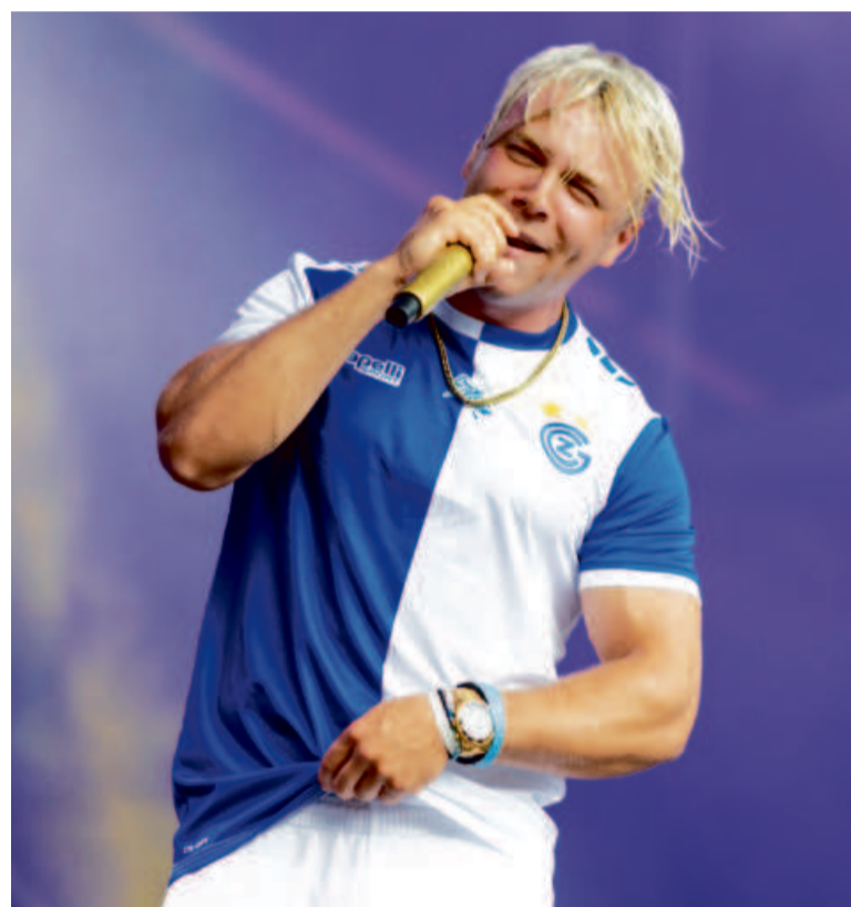
Skolim - bożyszcze nie tylko nastolatek