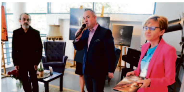
Burmistrz otworzył tego dnia dwie wystawy MOKiS-u