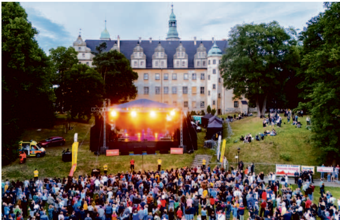
Główne koncerty odbyły się tradycyjnie na tle zamku