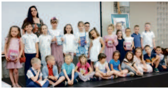
Spotkanie z autorką serii o Tymku i Czarnym Kocie Sylwią Winnik

Narodowe Centrum Kultury ogłosiło wyniki konkursu dotacyjnego „Blisko”. Spośród wielu wniosków zgłoszonych z całej Polski wybrano 47 projektów do realizacji i finansowania. Projekt Oleśnickiej Biblioteki Publicznej im. Mikołaja Reja w Oleśnicy „Przygodę z biblioteką w Oleśnicy czas zacząć!” zajął 6. miejsce.