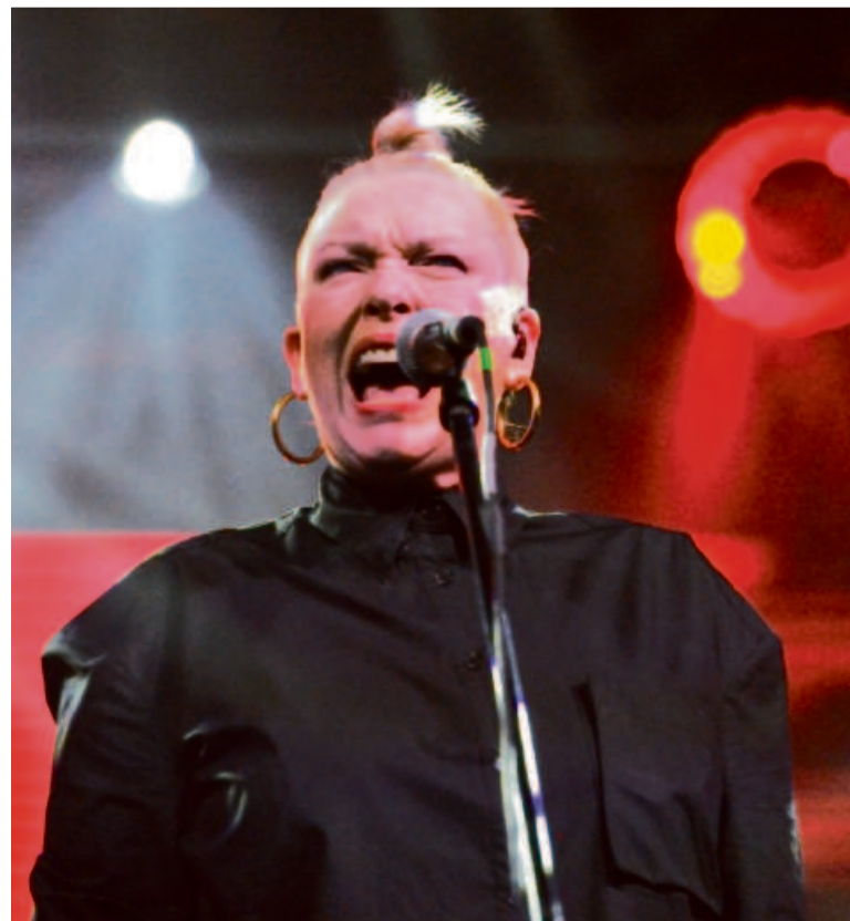
Katarzyna Nosowska - ikona polskiego rocka