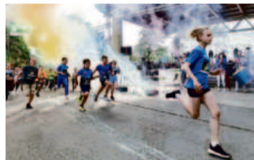
Rywalizację dorosłych poprzedziły biegi dzieci - Wielton 4 Kids

Aż 51 sztafet walczyło o laur zwycięstwa