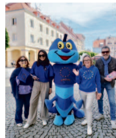
Syriusz pojawił się w Oleśnicy i bawił przechodniów

Celem gry miejskiej była nie tylko zabawa, ale także poszerzenie wiedzy o UE i jej krajach członkowskich, w tym o Polsce i mieście Oleśnica. ●