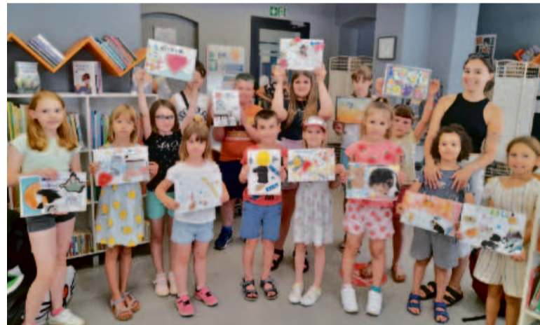
Warsztaty w Bibliotece „Pod Sową”? Na pewno chętnych nie zabraknie!

I jeszcze zapowiedź: 6 lipca i 3 sierpnia w godz. 15-21 w sali konferencyjnej kolejne „ Rejówki w Bibliotece ”. ●