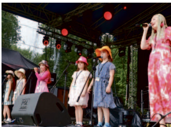
A to nasze przyszłe gwiazdy z warsztatów wokalnych MOKiS-u