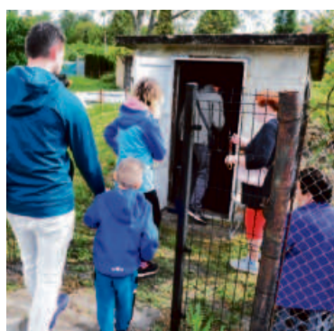
Wyposażeni w latarki mogli obejrzeć przedwojenny schron