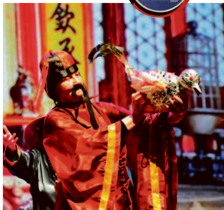
Aktorzy z Dziennego Domu Senior+ stworzyli prawdziwy teatr

Innymi przygotowanymi specjalnie na ten dzień propozycjami były: wystawa prac plastycznych będących plonem konkursu Miejskiej Gospodarki Komunalnej sp. z o.o. w wieży