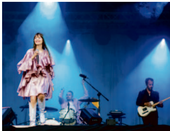
Sorry Boys łączy pop z muzyką alternatywną