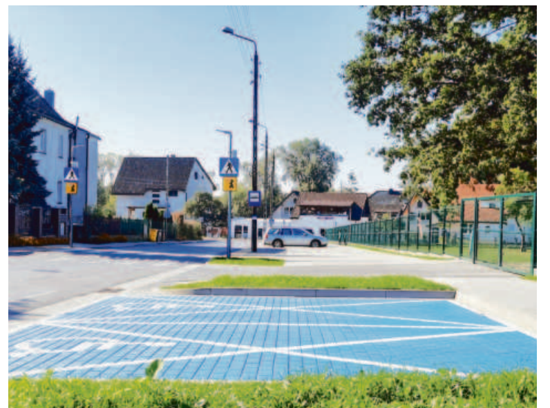
Na ul. Wielkopolej obok szkoły powstały bezpieczne zatoki parkingowe

Dla lepszego utrzymywania w dobrym stanie chodników i ścieżek rowerowych dokonano zakupów sprzętu: głowicy ze szczotką stalową do czyszczenia nawierzchni, kosiarki bijakowej do rozdrobnienia pozostałości roślin, dwóch małych piaskarek. ●