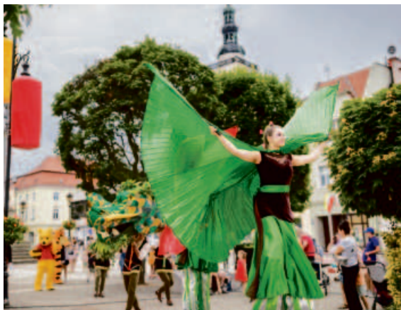
Tak barwnie i radośnie rozpoczęliśmy Dni Oleśnicy 2024