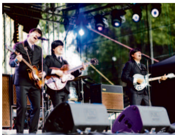
The Beatles Revival – John, Paul, George i Ringo jak żywi!