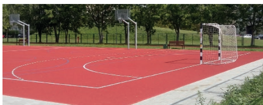
Bosiko SP 6

Oświata. Zespół Oświaty Samorządowej podsumował wydatki na remonty i inwestycje w oleśnickich szkołach podstawowych oraz przedszkolach prowadzonych przez Miasto. W sumie w roku szkolnym 2018/2019 wyniosły one prawie 1,6 miliona złotych. Wśród największych inwestycji znalazły się: budowa wielofunkcyjnego boiska sportowego i miasteczka ruchu drogowego przy Szkole Podstawowej nr 6, której koszt wyniósł prawie 320 tys. zł (na zdjęciu), stworzenie placu zabaw przy Szkole Podstawowej nr 8 (koszt to ok. 150 tys. zł) oraz modernizacja boiska i nagłośnienie sali gimnastycznej w Szkole Podstawowej nr 2 (130 tys. zł). Spore wydatki pochłonęły niezbędne remonty przeprowadzane m.in. przy Szkołach Podstawowych nr 1, nr 3 oraz nr 4, a także w przedszkolach. – Troska o jakość edukacji to nie tylko dbałość o wysoki poziom kształcenia, kompetencje nauczycieli, ale także o warunki, w jakich najmłodszy oleśniczanin zdobywa wiedzę i nowe umiejętności – tłumaczy Grażyna Dłubakowska, dyrektor Zespołu Oświaty Samorządowej, dodając, że obecnym władzom miasta zależy na tym, by warunki te były coraz lepsze. Pani dyrektor zaznacza, że to tylko część wydatków ponoszona przez miasto na szeroko pojętą edukację. Do nich należy doliczyć m.in. wyposażenie 28 pra-