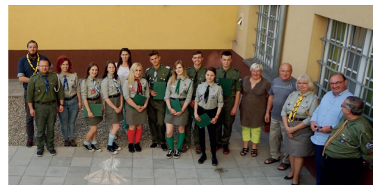
W oleśnickim hufcu ZHP działa 130 zuchów i harcerzy

W ZHP. Doskonałym pomysłem okazała się inicjatywa zagospodarowania pomieszczeń przy ul. Lwowskiej 3 (w których niegdyś funkcjonował pub) w taki sposób, by służyły harcerzom zrzeszonym w Hufcu ZHP im. Bohaterskich Lotników Polskich. Prace sfinansowano w ramach środków Oleśnickiego Budżetu Obywatelskiego. Ich koszt wyniósł prawie 250 tys. zł. Poza gruntownym remontem pomieszczeń przebudowano także nawierzchnię podwórza i wykonano schody zewnętrzne. Dziś budynek służy 130 zuchom i harcerzom, wędrow-