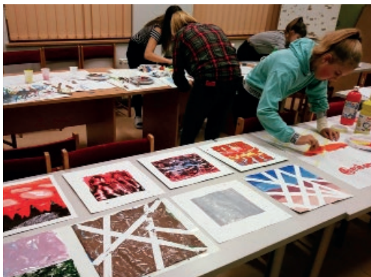
W warsztatach „Środy ze sztuką” młodzież z Klubu Młodzieżowego Mikser poznała techniki malarskie - malowanie bez pędzla