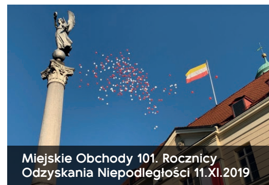
Miejskie Obchody 101. Rocznicy Odzyskania Niepodległości 11.XI.2019