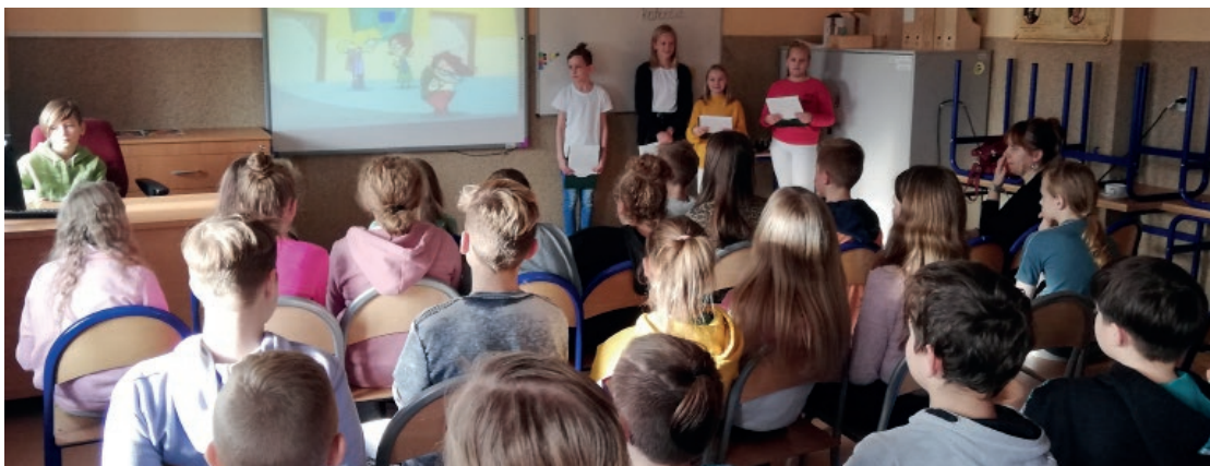
Programem objętych jest około 300 uczniów oleśnickich szkół