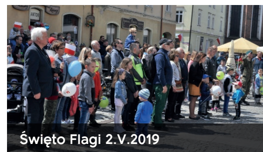
Święto Flagi 2.V.2019