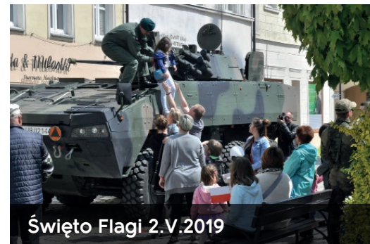
Święto Flagi 2.V.2019