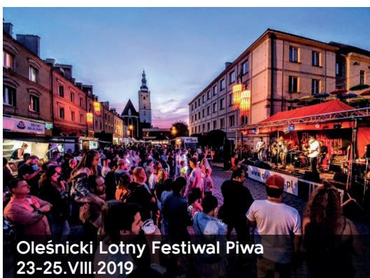
Oleśnicki Lotny Festiwal Piwa 23-25.VIII.2019