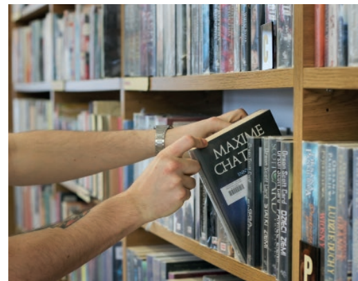
Księgozbiór Oleśnickiej Biblioteki Publicznej liczy 73 606 książek