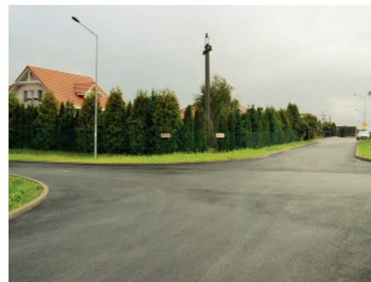
Mieszkańcy ulic Pogodnej i Tęczowej mogą korzystać z nowych dróg o asfaltowej nawierzchni