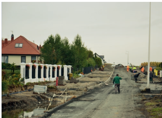
Inwestycje drogowe zawsze pozostaną jednymi z priorytetowych zadań – zapewniają władze miasta (ul. Kusocińskiego)

także chodnik i ciąg pieszo-rowerowy. Łączne dofinansowanie tych inwestycji to ponad 1,6 mln zł. Z nowej asfaltowej nawierzchni cieszą się także mieszkańcy ul. Pogodnej i Tęczowej, którzy dotychczas zmuszeni byli korzystać z drogi gruntowej. Kolejnymi usatysfakcjonowanymi będą mieszkańcy ul. Polnej i Kusocińskiego. Ci pierwsi poza nową nawierzchnią i chodnikami otrzymają również zatoki parkingowe i oświetlenie uliczne, a drudzy – ścieżkę rowerową. Obie te inwestycje są wyjątkowo kosztowne. Pochłoną 4,6 mln zł. Udało się częściowo zrekomensować wydatki na ul. Polną, pozyskując czterdziestoprocentowe dofinansowanie z budżetu państwa. Stan dróg jest niewątpliwie wizytówką miasta, ale przede wszystkim ma ogromny wpływ na komfort życia mieszkańców, dlatego – jak zapewniają władze – inwestycje drogowe zawsze będą jednymi z priorytetowych zadań.