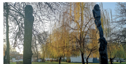
Już niedługo nowe rzeźby Zbigniewa Podurziela będą ozdobą terenów przy ul. Rzemieślniczej