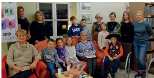
Jednym z zadań biblioteki jest promowanie czytelnictwa wśród oleśniczan

Każdego roku publikacja danych opisujących stan czytelnictwa w Polsce wywołuje uczucie przykrości i smutku. Skrajni optymiści próbują pocieszać, twierdząc, że zawsze mogło być gorzej. Marne to wytłumaczenie, kiedy słyszymy, że jedynie co trzeci obywatel sięga po jakąkolwiek literaturę. Jak sytuacja wygląda w naszym mieście? Na tak postawione pytanie trudno jednoznacznie odpowiedzieć, gdyż nikt nie wyodrębnił w tych badaniach wyników dotyczących mieszkańców Oleśnicy. Wiemy jednak, że w ostatnim czasie zwiększyła się liczba osób korzystających z Oleśnickiej Biblioteki Publicznej. Dziś wynosi ona ponad 6 000 osób. W ciągu ostatniego roku wypożyczyły one łącznie 111 040 książek, audiobooków i dokumentów elektronicznych. Największym powodzeniem cieszą się cykle kryminalne, powieści związane z historią II wojny światowej i powojenną, fantastyka, sagi rodzinne, książki podróżnicze,