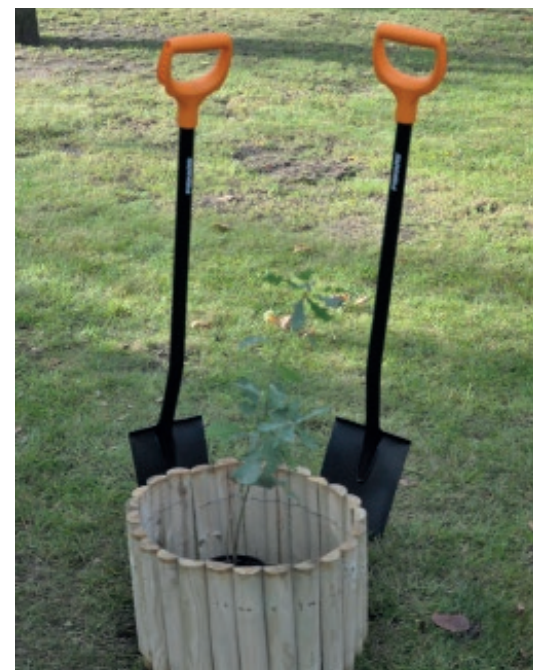
Od każdego z nas zależy, czy powietrze którym oddychamy nie będzie szkodziło naszemu zdrowiu

było 80 nowych drzew. Zostały one posadzone m.in. w Parku nad Stawami i w Parku Mikołaja Kopernika. Dodatkowo przy ul. Rzemieślniczej pojawiło się 200 sztuk krzewów kalmii szerokolistnej. Planuje się także zasadzenie róż-