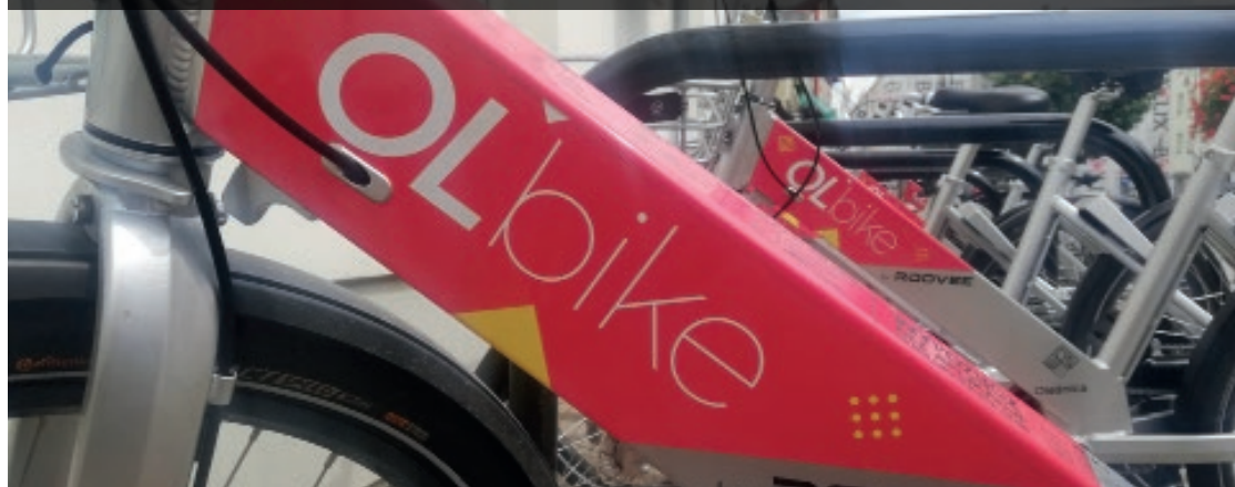
Oleśnickie rowery w sumie były w ruchu przez 4 367 godzin, 47 minut i 41 sekund

tu. Za godzinę jazdy płacono się jedynie trzy złote. O sporym powodzeniu wypożyczalni świadczą statystyki. Miejskie jednoślady przejechały w sumie 28 219,97 km. Do systemu zalogowało się prawie 1200 użytkowników. Łączny czas korzystania z rowerów to 4 367 godzin, 47 minut i 41 sekund. – To nie tylko alternatywny środek transportu, umożliwiający poruszanie się po mieście, ale także pewien styl życia i aktywny sposób spędzania wolnego czasu, który na stałe zagościł w 165 krajach świata – zauważa burmistrz Oleśnicy i zapowiada, że w przyszłym roku oleśnicka baza rowerowa powiększy się o 20 nowych jednośladów. Powstaną też trzy nowe stacje, a oleśniczanie nie będą musieli z wypożyczeniem roweru czekać aż do lipca. System bowiem ma ruszyć na wiosnę, w maju. Warto zauważyć, iż równolegle z rozwojem miejskiej wypożyczalni rowerów rośnie ilość ścieżek rowerowych w naszym mieście. W ostatnim czasie ukończona została budowa ciągu pieszo – rowerowego wzdłuż nasypu kolejowego przy ul. Dąbrowskiego i Wiejskiej. Zakończyły się także prace przy budowie kolejnych ścieżek dla jednośladów, przy ulicach: Reja, Ludwikowskiej, Kolejowej, 11 Listopa-