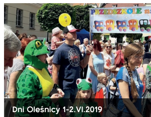
Dni Oleśnicy 1-2.VI.2019