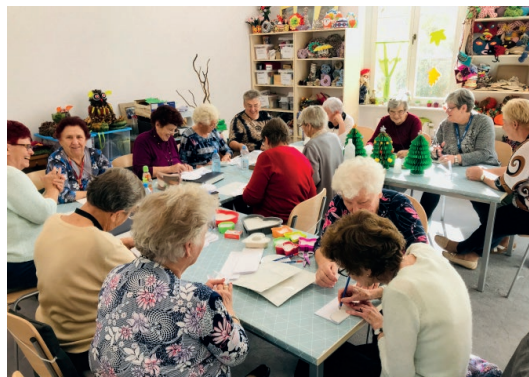
Każdy, kto ukończył 60 lat może skorzystać z bogatej oferty Oleśnickiego Domu Seniora

w wydarzeniach kulturalnych oraz wycieczkach krajoznawczych. Seniorzy mogą też zdobyć tutaj wiedzę na temat korzystania z nowych technologii, na przy-