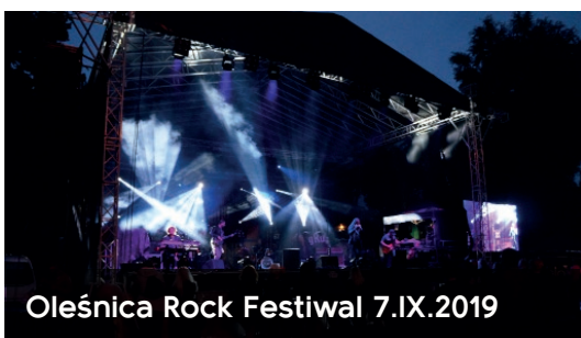
Oleśnica Rock Festiwal 7.IX.2019