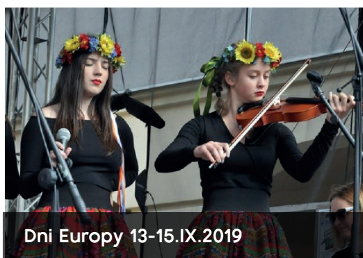
Dni Europy 13-15.IX.2019