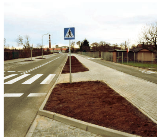
Ulice i chodniki są swoistego rodzaju wizytówką miasta (ul. Limanowskiego)