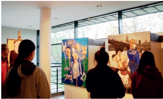
Wernisaż wystawy Edward Dwurnik - „Malarstwo i Rysunek”, w pierwszą rocznicę śmierci artysty

KO: Jednym z takich projektów jest program Nowe Horyzonty Edukacji Filmowej . Chodzi o to, by odciągnąć młodych ludzi od Netflixa i tabletów, a przyciągnąć do kina?