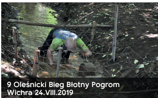
9 Oleśnicki Bieg Błotny Pogrom Wichra 24.VIII.2019