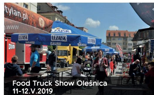
Food Truck Show Oleśnica 11-12.V.2019