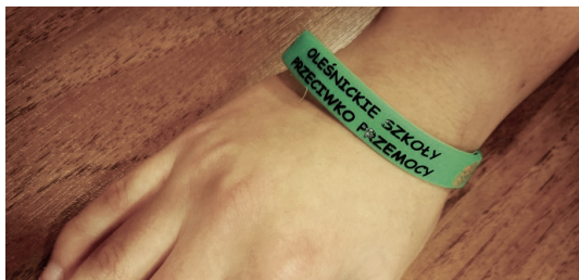
Opaska to jedynie symbol, który każdego dnia ma przypominać o konieczności walki z przemocą

Najgorzej jest, kiedy człowiek rozłoży ręce i powie, że nic nie może zrobić lub zacznie jedynie narzekać na złe wychowanie, media, gry komputerowe i brak poszanowania dla podstawowych wartości – mówią pomysłodawcy programu „Oleśnickie szkoły przeciwko przemocy”, który jest realizowany wśród uczniów najstarszych klas szkół podstawowych w naszym mieście. Jego założeniem jest przeciwdziałanie przemocy, zarówno doświadczanej w rodzinie lub pomiędzy rówieśnikami, jak i obecnej w internecie. Uczniowie podczas spotkań, warsztatów i prelekcji zdobywają nie tylko wiedzę na temat źródeł przemocy i sposobów reagowania na nią, ale także dowiadują się, jak chronić siebie i in-