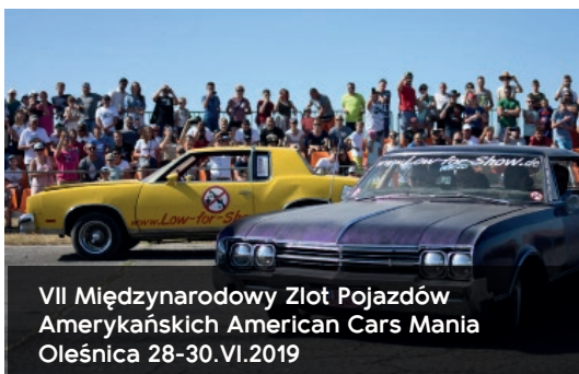
VII Międzynarodowy Zlot Pojazdów Amerykańskich American Cars Mania Oleśnica 28-30.VI.2019