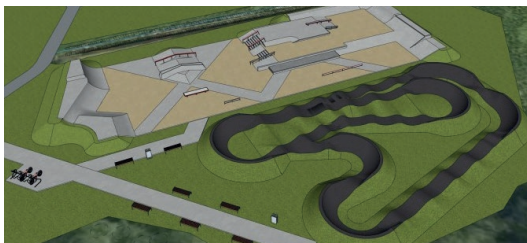
Już niedługo oleśnicka oferta rekreacyjna powiększy się o skate park oraz pumptruck

Pomysł narodził się w 1998 r. we Francji. Do Polski zawitał 15 lat później i jako pierwsi cieszyli się z niego mieszkańcy Gdańska. Niedługo pojawi się także w Oleśnicy.